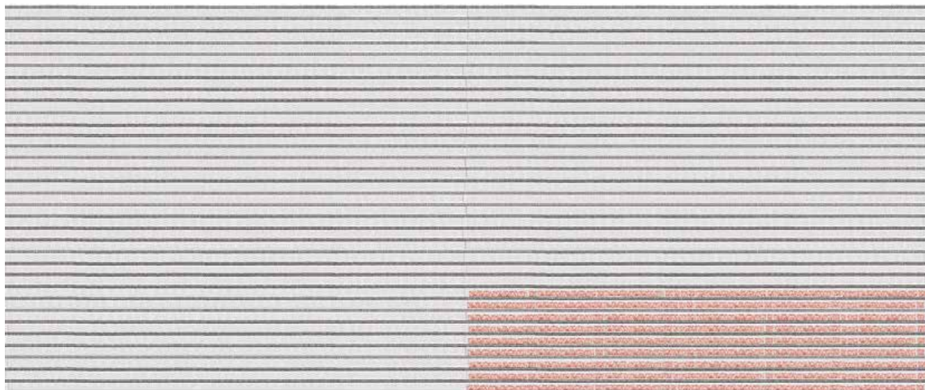
Illustration: Codesign Research Studio