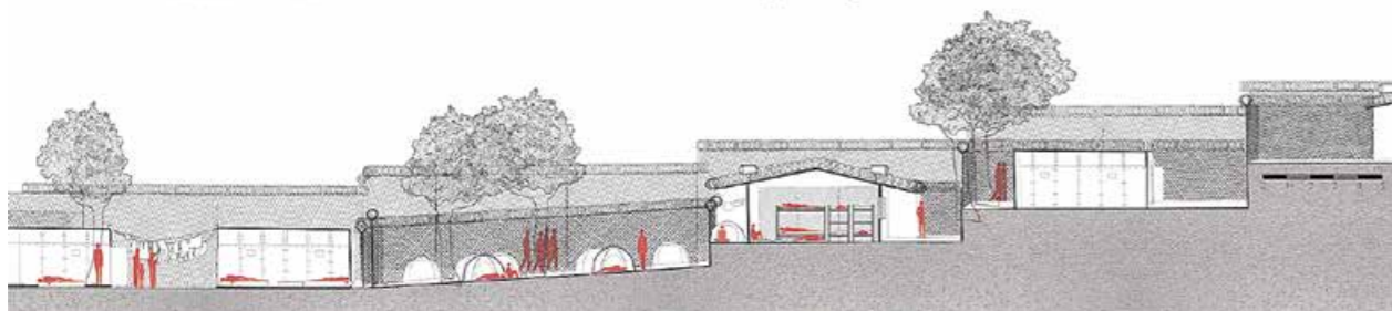
Snitt av förvaret i Moria som visar proportioner mellan byggda strukturer i lägret.

Tidigare år har CoRS jobbat tematiskt med asylboenden i Sverige och med arkitekturen längs Europas gränser. I år knyter de ihop dessa tidigare teman genom att undersöka de rumsliga situationer en flykting kan möta längs vägen, över gränsen till södra Europa, på sin väg över kontinenten och slutligen i Sverige i norr.